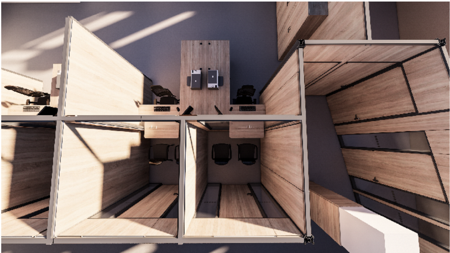
3NP - PŘEPÁŽKOVÁ PRACOVISTĚ, ŽIVNOSTENSKÝ ÚŘAD