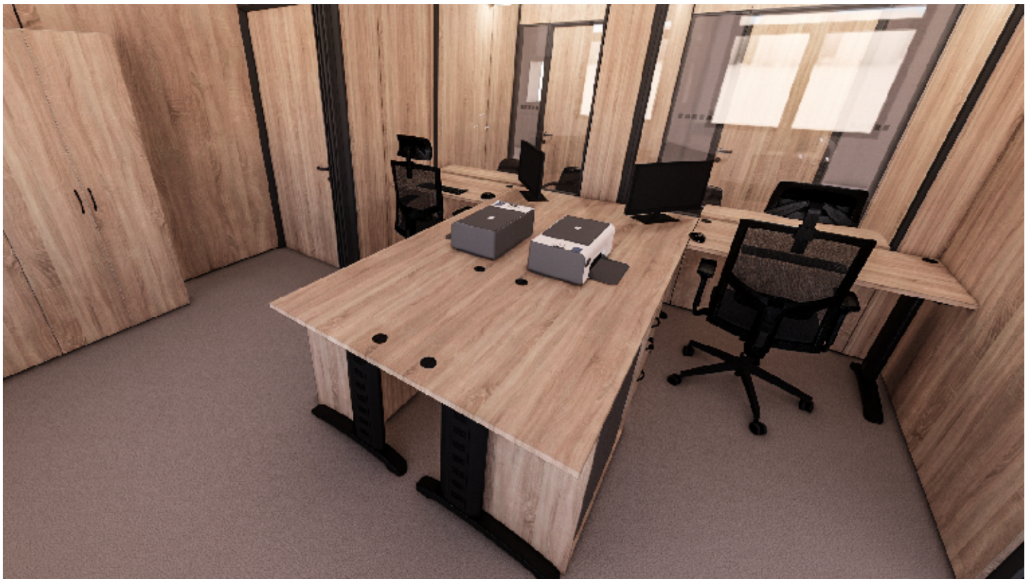
3NP - PŘEPÁŽKOVÁ PRACOVISTĚ, ŽIVNOSTENSKÝ ÚŘAD - ZÁZEMÍ

VÝŠKOVÝ SYSTÉM Bpv, SOUŘADNICOVÝ JTSK ±0,000 = 251,28m N. M.